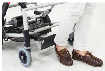
Swing away footrest makes it easy to get in or out