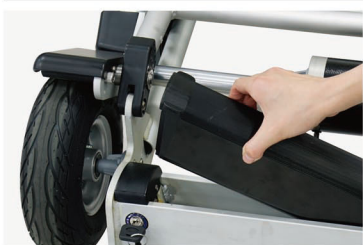
Removable Li-ion battery pack more stable and the lifetime is three times longer than traditional lead acid batteries