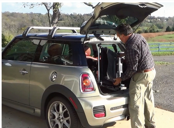
Flat and parallel shape when folded facilitates loading into the trunk of small car