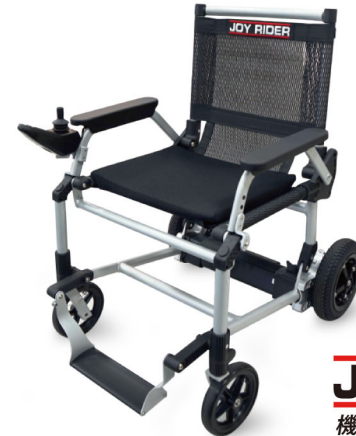
JOY RIDER 機動性を取り戻します