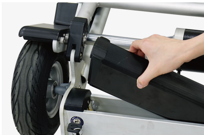
取り外しが可能なバッテリーパック