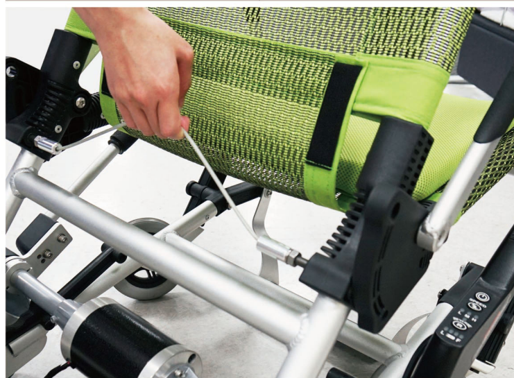
2 secs folding mechanism easy and convenient