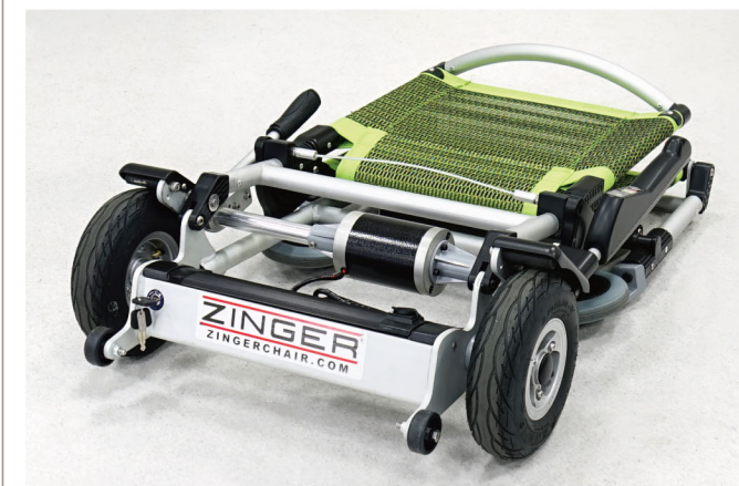
シンプルなデザイン 最小限のスペースで自宅やオフィスに保管できます