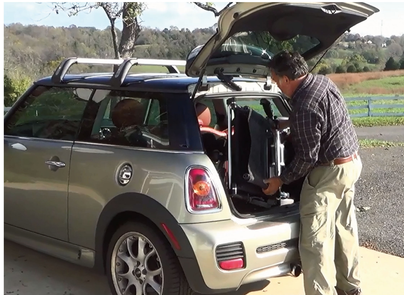
フラット状態 折りたたむと小型車のトランクなどへ簡単に積み込めます