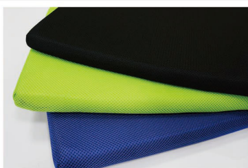
Three colors available with fireproof and high quality upholstery