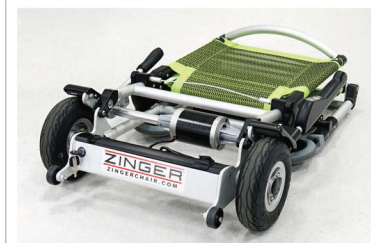
Compact design requires minimum space when storage in home or office