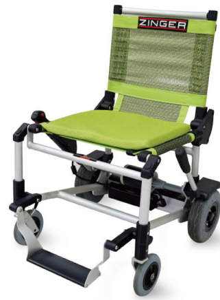
ZINGER どこへでも行きます